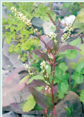
La renouée ponctuée

Espèces semblables : La renouée ponctuée ( Polygonum punctatum ) a des fleurs roses, et les pétales et sépales sont tachés par des petites glandes. La renouée robuste ( Polygonum robustius , page 22) est typiquement plus haute (jusqu'à 1 m), et assez robuste avec une tige épaisse et des fleurs blanches. La renouée poivre-d'eau ( Polygonum hydropiper ) pousse assez abondamment. Ses regroupements de fleurs sont plus minces et se trouvent plus proches au bas de la plante lorsque les feuilles rencontrent la tige. Ses fleurs sont surtout verdâtres ou blanchâtres. Ces trois espèces goûtent fortement le poivre.